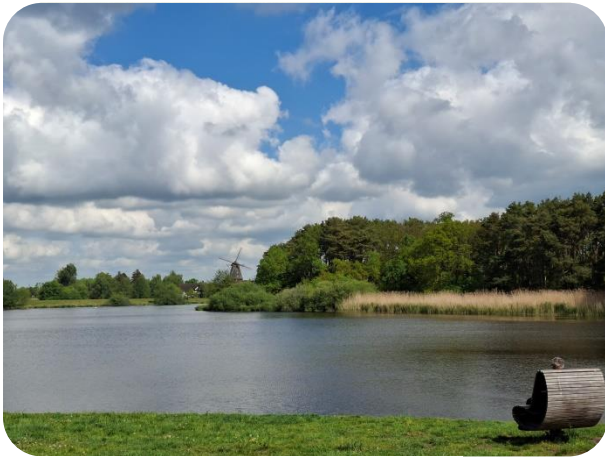
Schlossee mit Blick auf Mühlenmuseum

Der Schlossee in Gifhorn ist ein ca. 14 ha. großer, künstlich angelegter See. Wir machen eine großzügige, gut zwei Stunden lange Wanderung von ca. 7 km in dem beliebten Naherholungsgebiet, die uns auch in den frei zugänglichen Bereich des Mühlenmuseums führen wird.