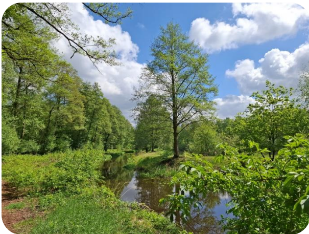
Entlang der Aller

Der Schlossee in Gifhorn ist ein ca. 14 ha. großer, künstlich angelegter See. Wir machen eine großzügige, gut zwei Stunden lange Wanderung von ca. 7 km in dem beliebten Naherholungsgebiet, die uns auch in den frei zugänglichen Bereich des Mühlenmuseums führen wird.