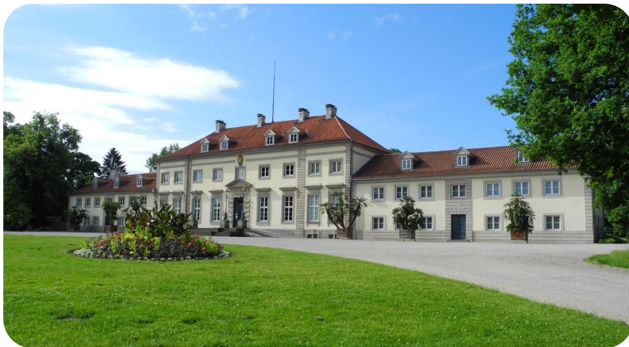
Wilhelm-Busch-Museum Hannover

Wer kennt sie nicht: Max und Moritz, Witwe Bolte, Lehrer Lempel und die fromme Helene. Mitten im berühmten englischen Landschaftsgarten in Hannover liegt das Museum Wilhelm Busch, das Deutsche Museum für Karikatur und Zeichenkunst.