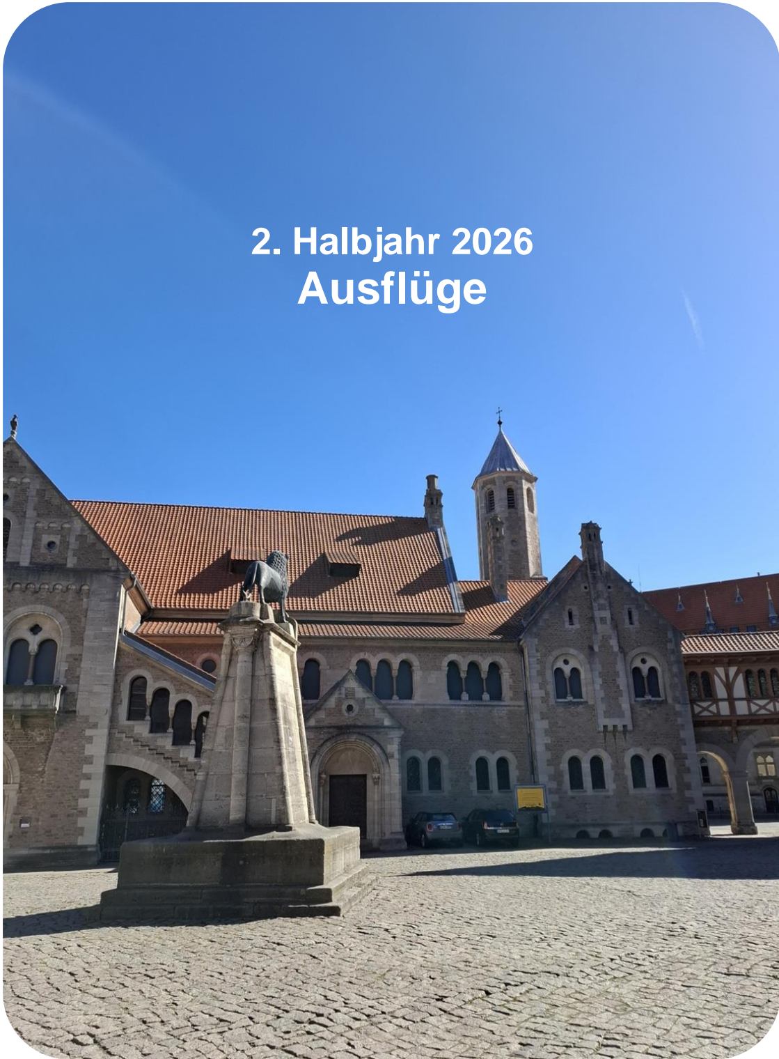
Braunschweig Burgplatz